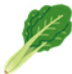
小松菜 70g 119mg