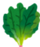
ほうれん菜 70g 34mg