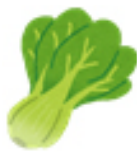
チンゲン菜 70g 70mg