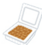
納豆 1P(100g) 36mg