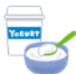
ヨーグルト 1/4P(100g) 231mg