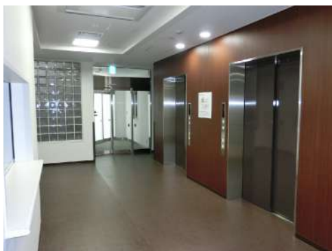
1階エレベーターホール